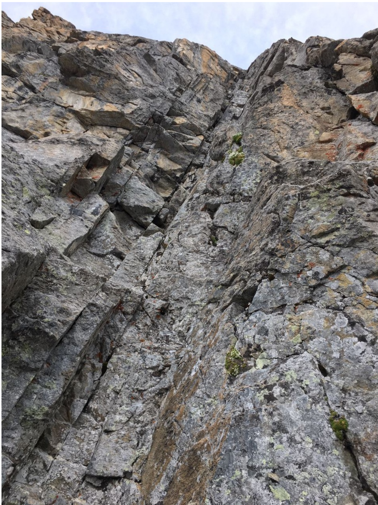
Ключевой участок маршрута- камин вершинной башни