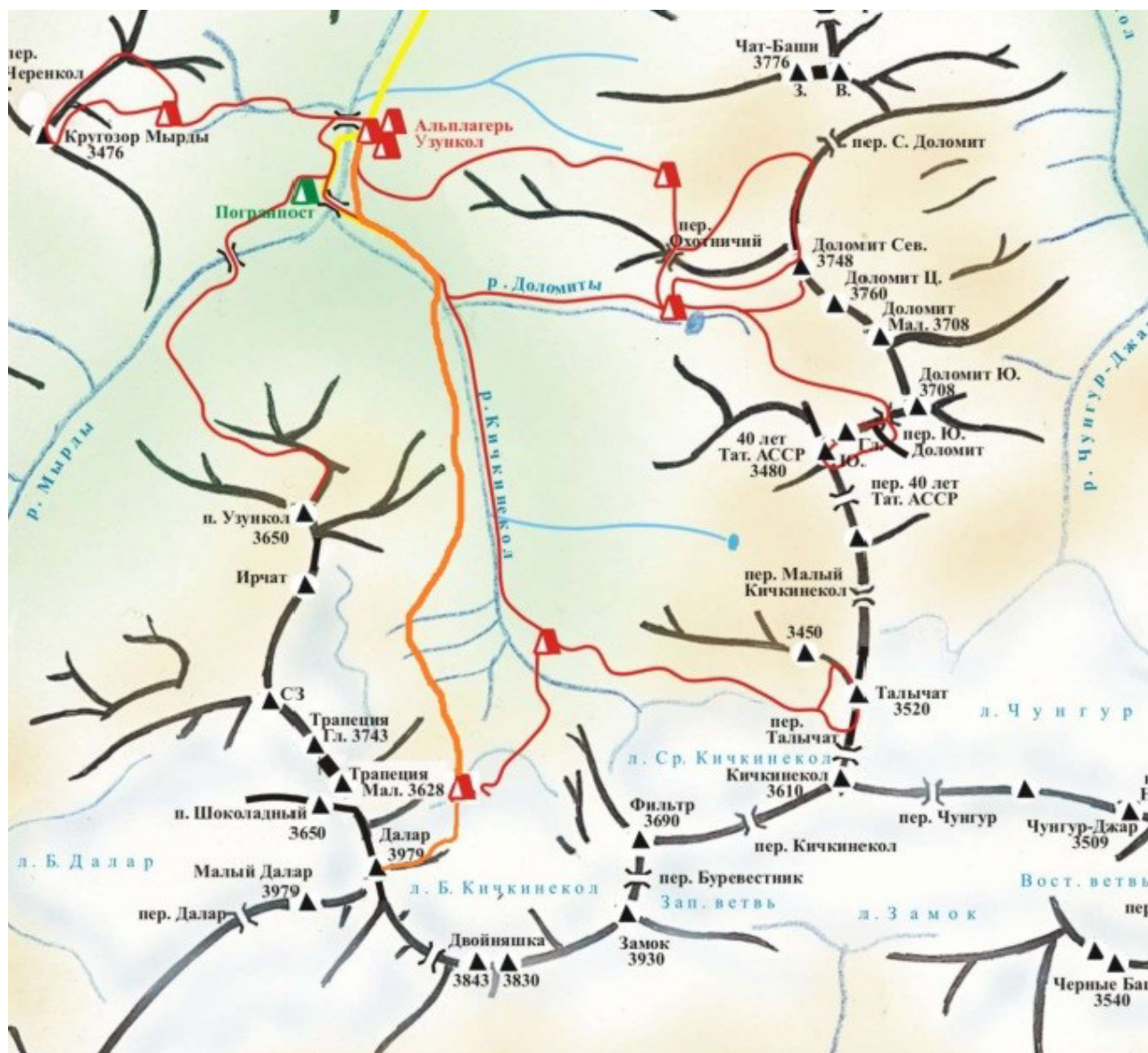
Схема района Узункол