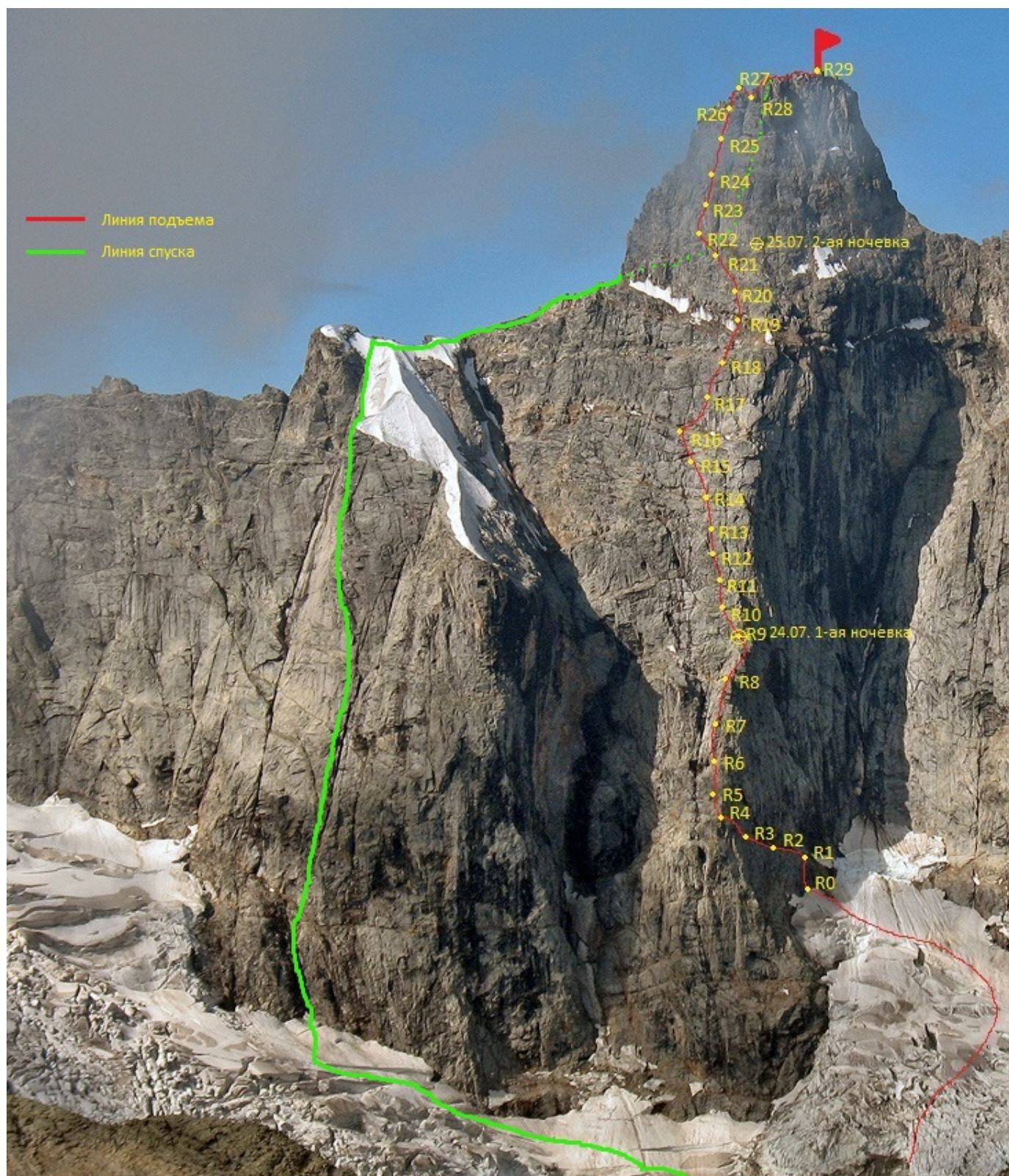
Техническое фото Далар 5Б по СВ ребру