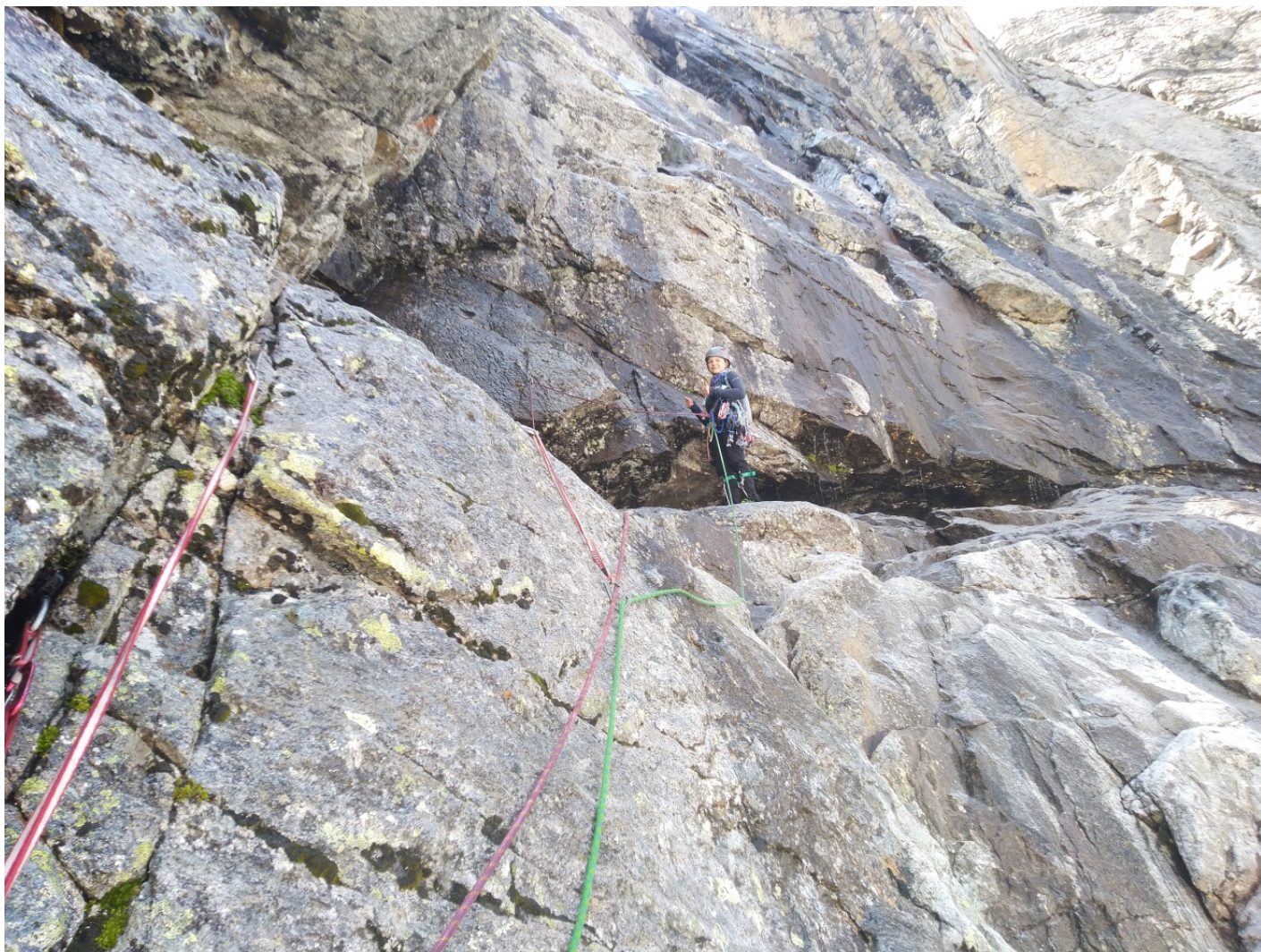
Работа на участке R18-R19