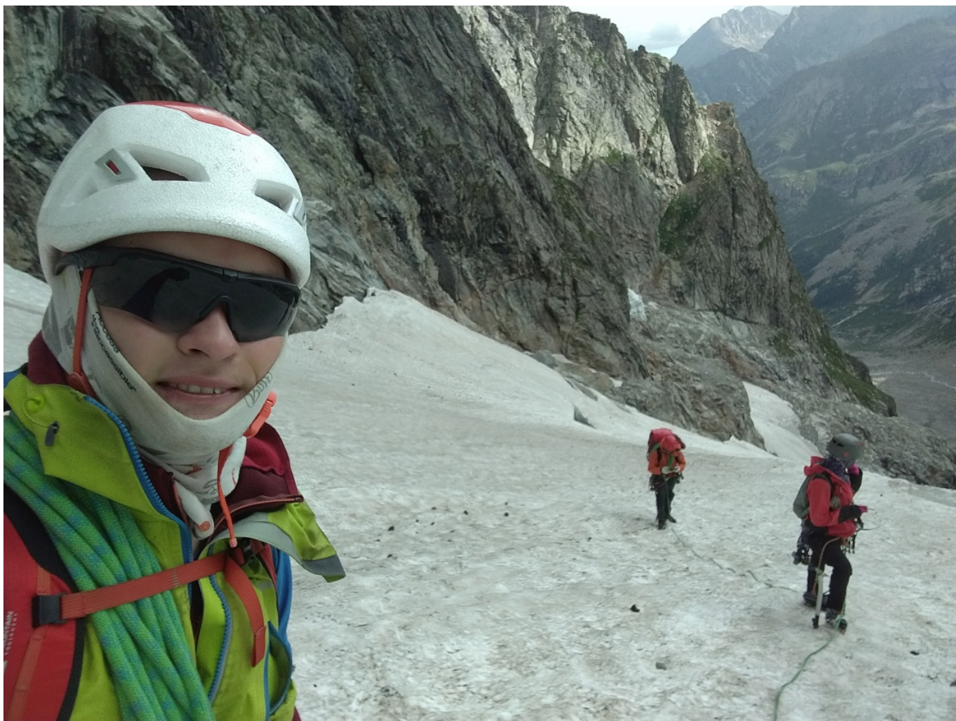
Подход под начало маршрута