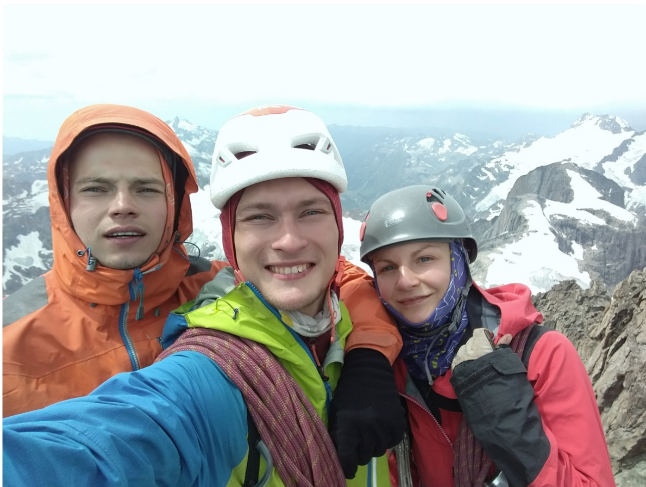
Общее фото на вершине