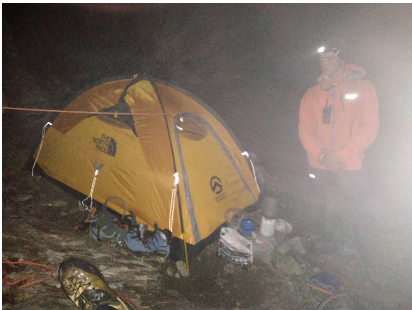
Вторая ночевка команды (участок R22)