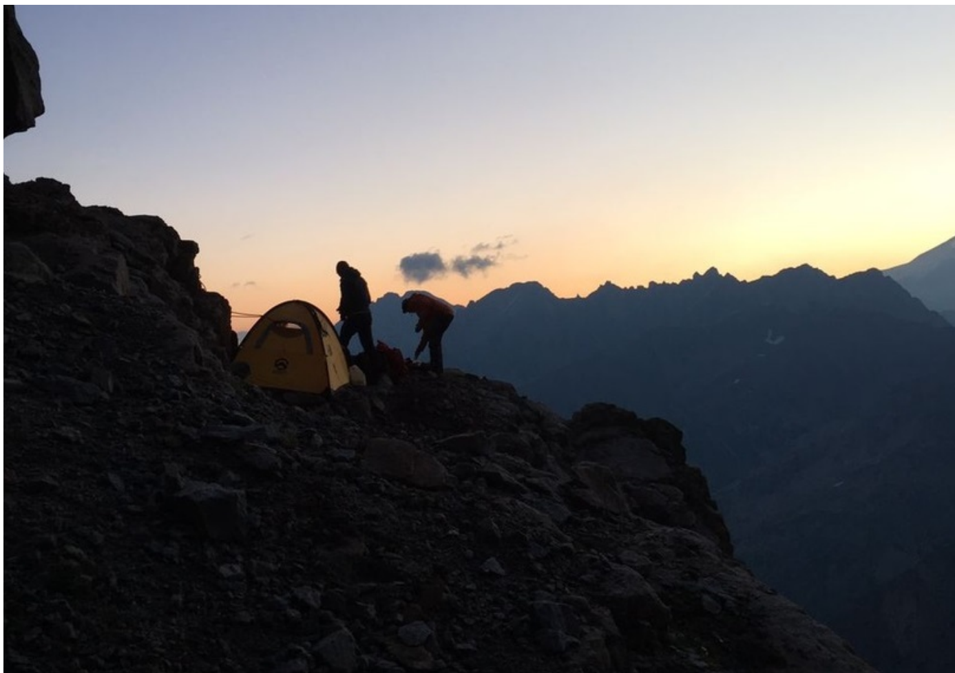
Первая ночевка команды(участок R9)