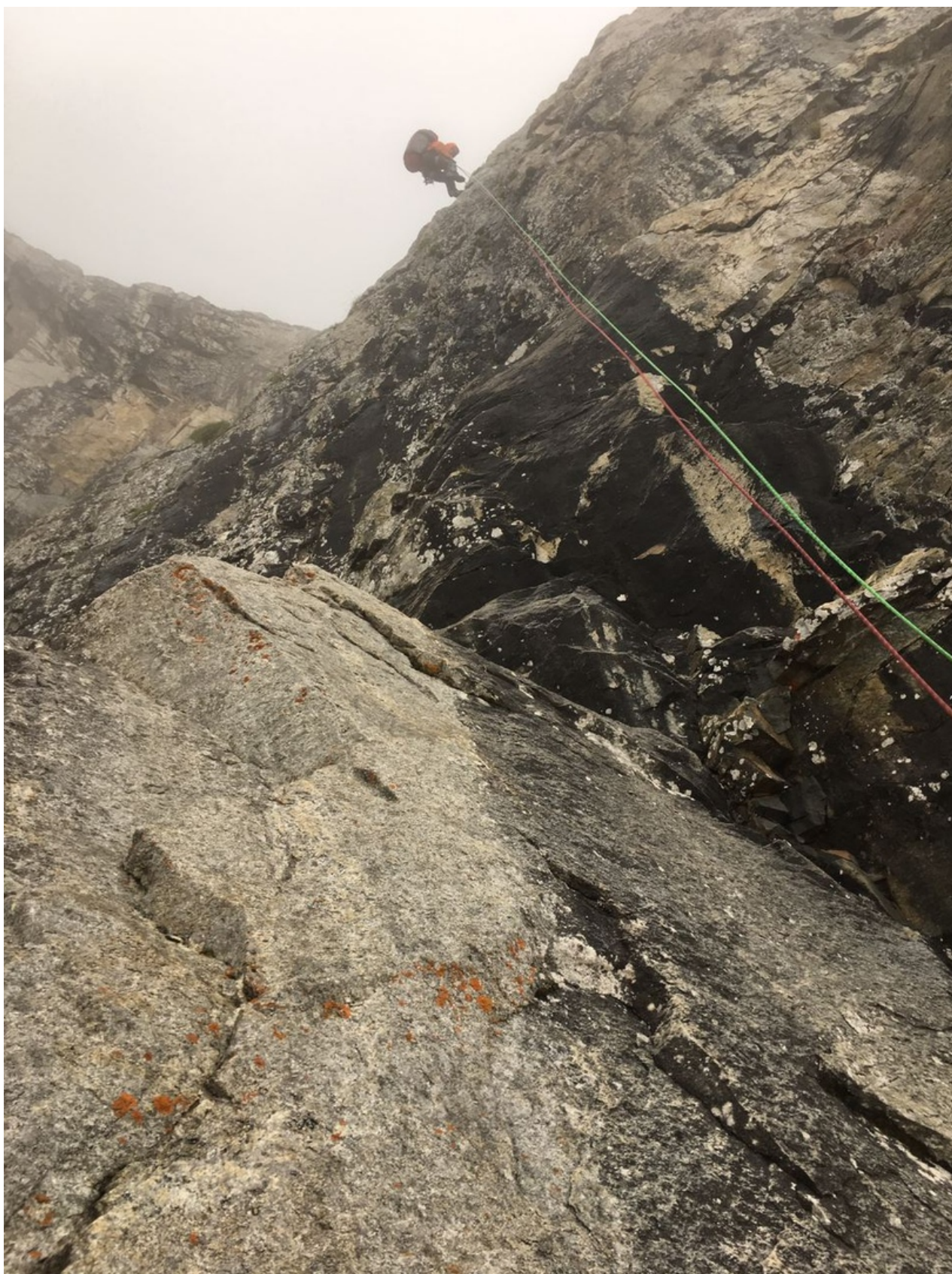
Спуск по «пробитым» дюльферам