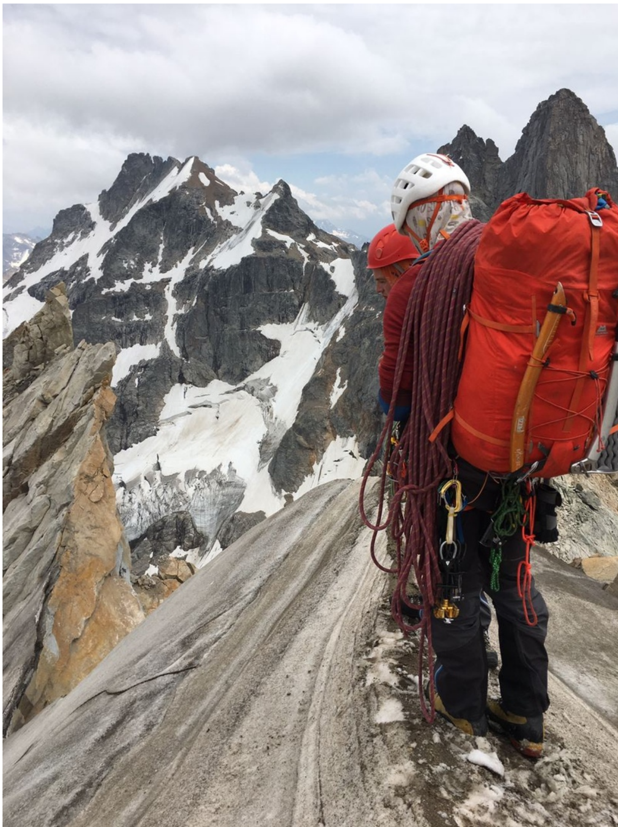
«Снежный нож» на спуске- начало дюльферов